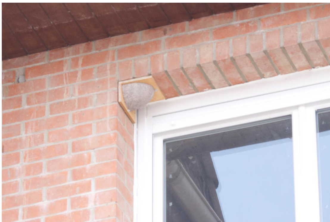
Photographie Nid Artificiel posé à l'envers

L'un des nichoirs a été posé à l'envers :