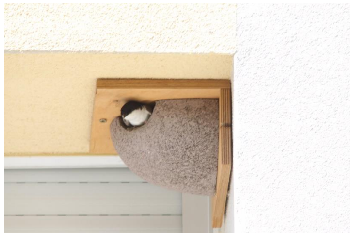
Photographies Nids d'Hirondelles de fenêtre